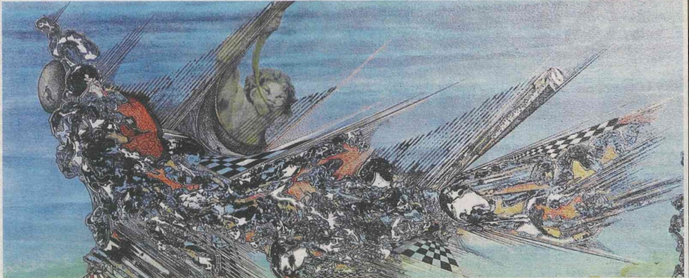
Le public peut également découvrir les peintures surréelles de Jacques Massard.